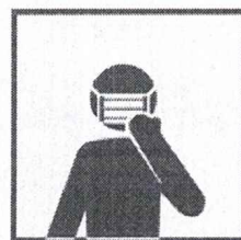
Пользуйтесь одноразовой маской