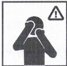
Не прикасайтесь к лицу немывтыми руками