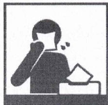
Пользуйтесь одноразовой бумажной салфеткой при чихании, кашле, насморке

Соблюдение следующих гигиенических правил позволит существенно снизить риск заражения или дальнейшего распространения гриппа, коронавирусной инфекции и других ОРВИ.