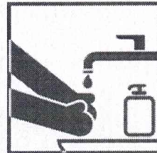
Чаше мойте руки