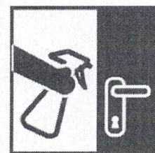
Влажная уборка дома ежедневно